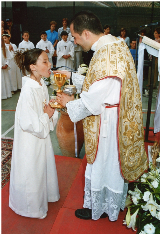
La communion d'une future adolescente